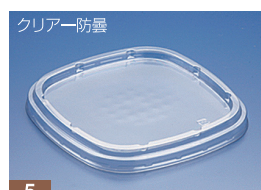
EC 178 FC ボードン