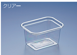
EC チョウカク-300B (BC)