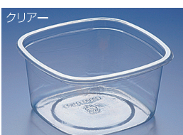
EC 178-2000B (BC)