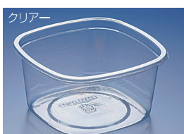
EC 178-2000B (A)