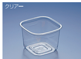
EC 104-500B (BC)