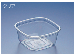
EC 126-500B (BC)