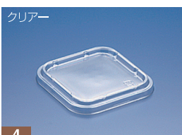
EC 116 FC (N)