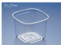
EC 126-1000B (A)