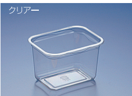
EC 500BTS (A)