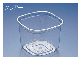
EC 126-1000B (BC)