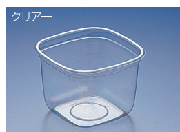
セイカク 1000B (BC)