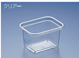
EC チョウカク-300B リブツキ (BC)