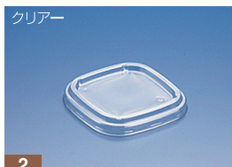
EC 104 FC (N)