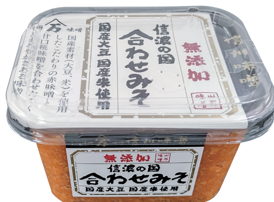
無添加 信濃の国合わせみそ

本体: EC チョウカク-300B (BC) フタ: EC チョウカク FC (N)