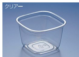
EC 126-750B (BC)