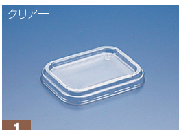
EC チョウカク FC (N)