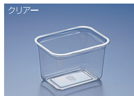
EC 500BTS (BC)