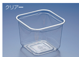
EC 116-751B (A)