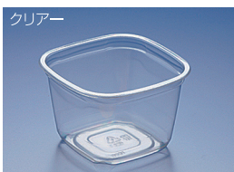
EC 126-750B (A) シン