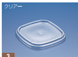
EC 126 FC (M)