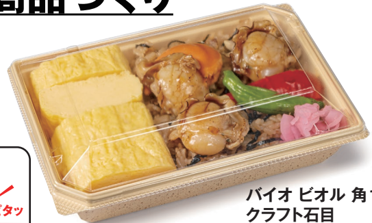
バイオ ビオル 角18-12B クラフト石目

サイズ: 175×121×36 フタ: バイオ ビオル 角18-12 OC (プライムビーフ&バターライス 約370g)