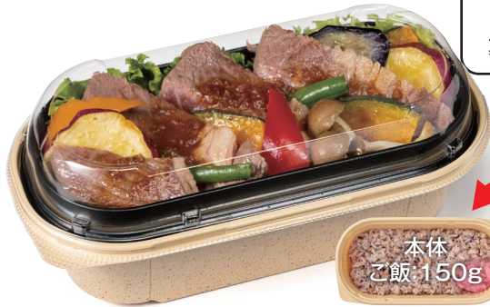
バイオ ビオル 小判20-10B クラフト石目

サイズ: 200×101×53 中皿: バイオ ビオル 小判20-10 中皿1 黒 フタ: バイオ ビオル 小判20-10 OC (彩り野菜とロースステーキ2段弁当 約430g)