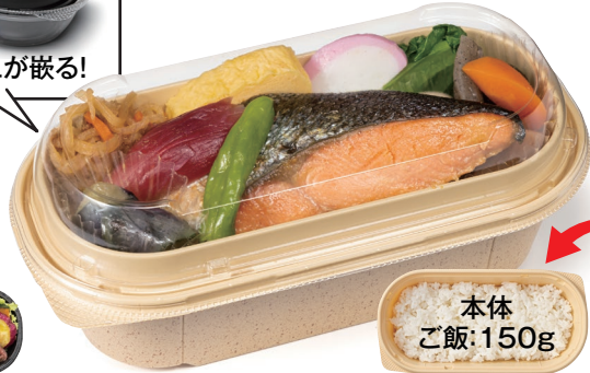
バイオ ビオル 小判20-10B クラフト石目

サイズ: 200×101×53 中皿: バイオ ビオル 小判20-10 中皿1 黒 フタ: バイオ ビオル 小判20-10 OC (彩り野菜とロースステーキ2段弁当 約430g)