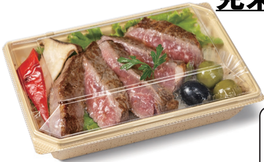
バイオ ビオル 角18-12B クラフト石目

サイズ: 175×121×36 フタ: バイオ ビオル 角18-12 OC (プライムビーフ&バターライス 約370g)